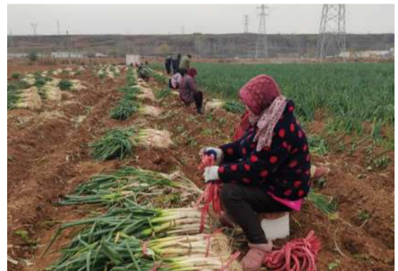
在田间地头采购蔬菜蔬菜,解决因疫情卖菜难问题

时间,将这批蔬菜送到玄武门大街改造工程、南山大道西延项目等在疫情期间坚持奋战在施工一线的作业人员以及受疫情影响封控在家的员工家里,送去一点暖暖的问候。(市政分公司工会)