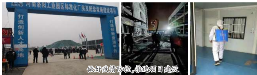
做好疫情防控,推进项目建设

员闭环管理,加强疫情防控消杀,把疫情带来的不利影响降到最低。目前,该项目1#楼、2#楼、3#楼、4#楼、7#楼、9#楼、10#楼、污水厂正处于装饰装修施工阶段,5#楼、6#楼、8#楼正处于主体结构施工阶段。项目管理人员与现场工人正紧密推进项目建设,保质保量完成施工任务,确保明年如期投产。(三分公司)