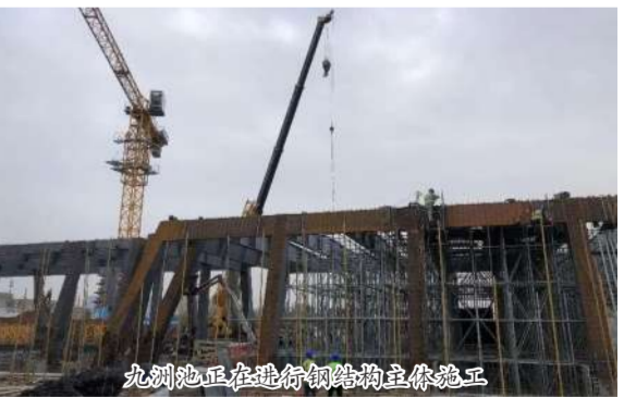
九洲池正在地街钢结构主体结构施工

九洲池遗址保护展示工程二期分为玄武门城墙、大内西墙、陶光园阁楼、陶光园南廊展示区,工程建筑面积约6600㎡,景观园建面积约27300㎡,该项目建成后将呈现一处具有盛唐气派的皇家宫院,推动洛阳隋唐城国家遗址公园建设。(五分公司)