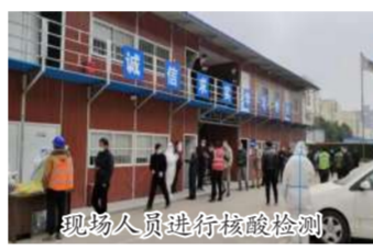
现场人员进行核酸检测